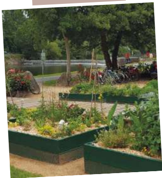
Pause à Montgiroux