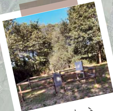
Rando à Courmondron