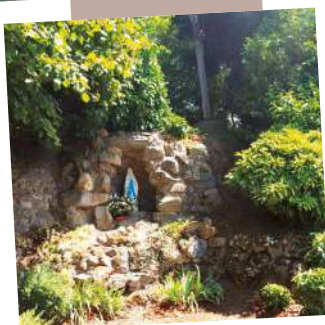
Découverte de la grotte