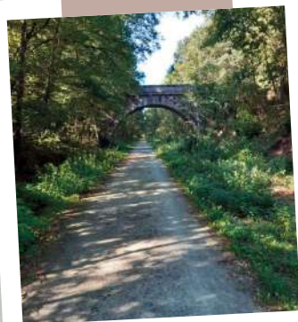
Balade en famille sur la voie verte