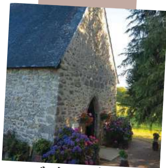
Visite de la Chapelle Saint Léger