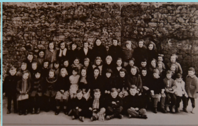
Classe en 1954

- En 1959, une école maternelle comprenant une classe et un logement est construite dans l'alignement de l'école des garçons. Le premier poste de femme de service (atsem) est ainsi créé. Une cantine scolaire en préfabriqué est également construite près de l'école. Les enfants éloignés du bourg, peuvent profiter de ce nouveau service.