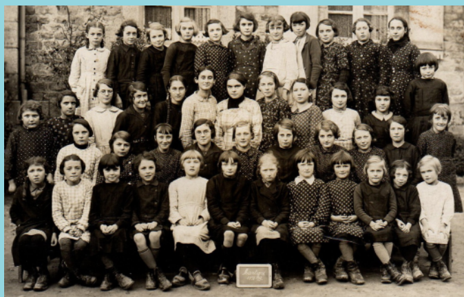
( Année scolaire 1938/1939)

57 garçons et filles sont accueillis principalement originaire de l'Aisne